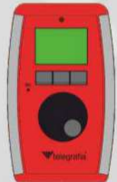
Profesional con la pantalla y el encoder

Los mandos a distancia pueden ser equipados por el lector de tarjetas Rfid para la identificación de manipulación y aseguración de activación sólo de personas autorizadas. Los dos tipos disponen de un micrófono integrado y facilitan la emisión del reportes en vivo.